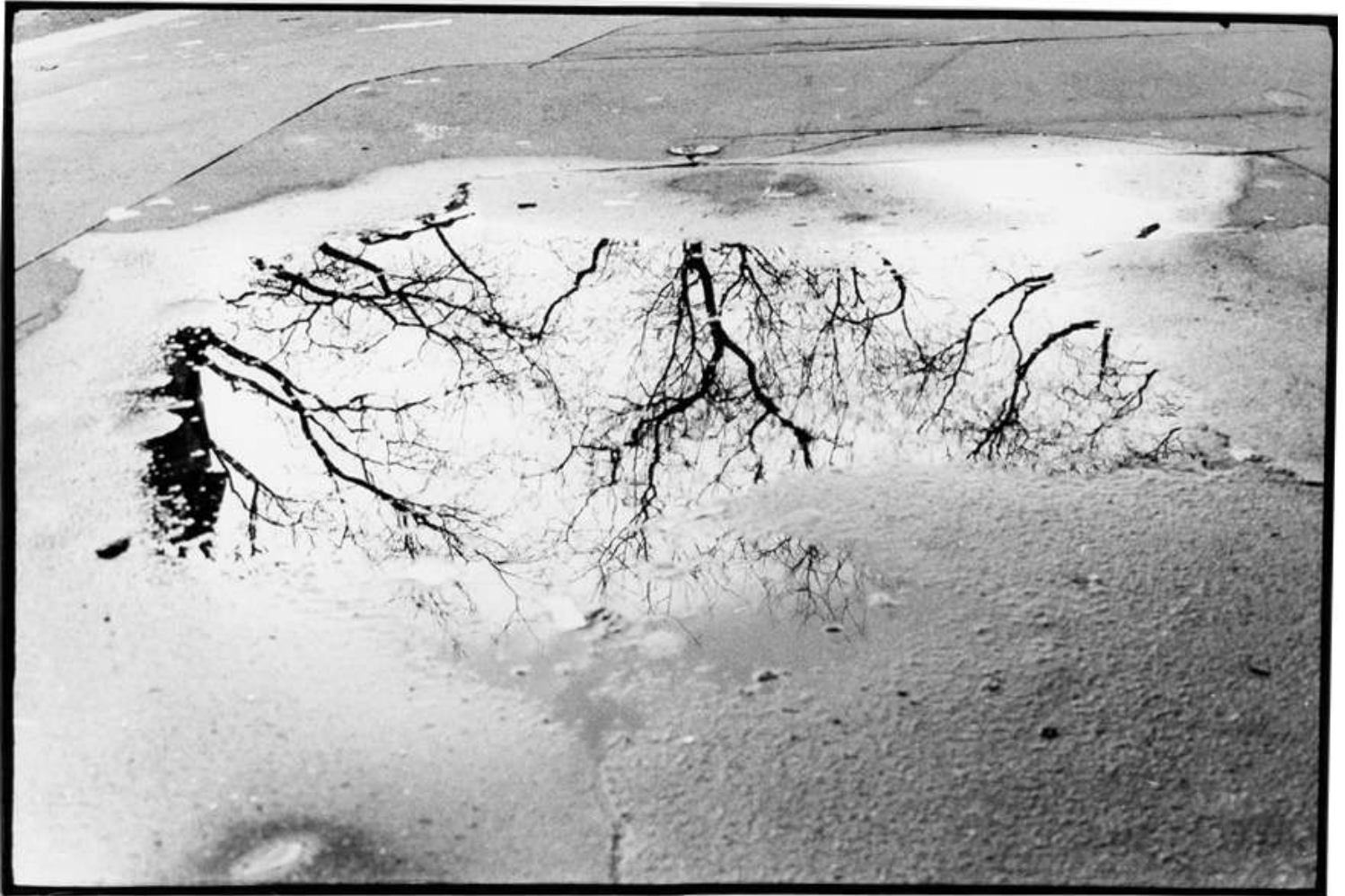
fotografia sense títol de hara kraan